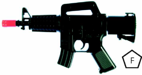
Schusswaffen (über 0,08 Joule) mit F-Zeichen